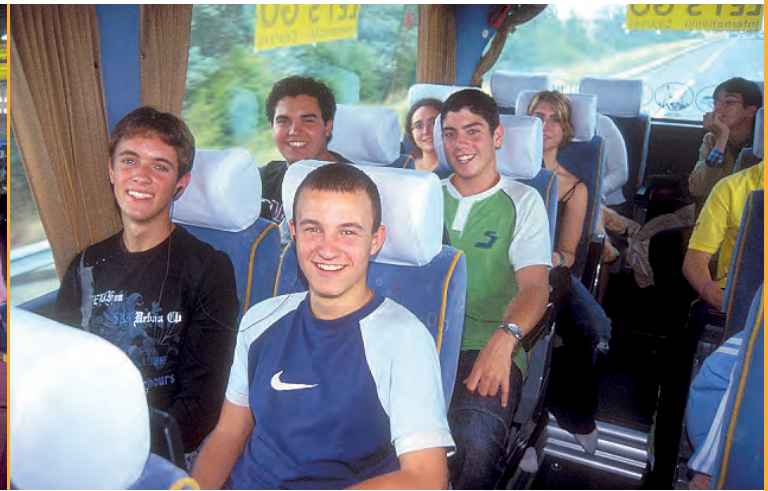
Realizarás los viajes de ida y vuelta en avión entre España e Inglaterra en grupo y con un profesor acompañante.