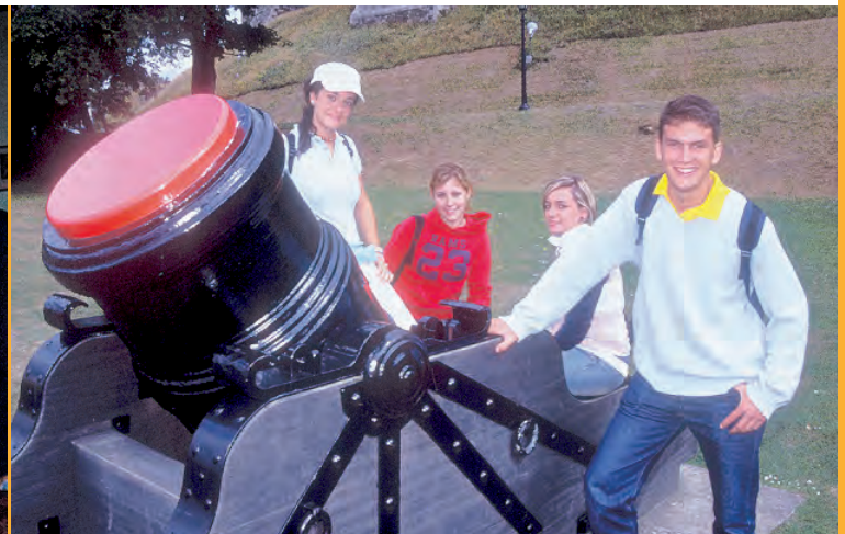
Estarás ocupado durante todo el tiempo y aprovecharás al máximo estos días de estancia en Inglaterra.