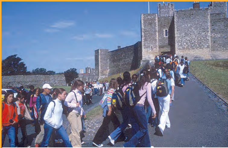
Realizarás una excursión en autocar o tren a otra localidad de interés.