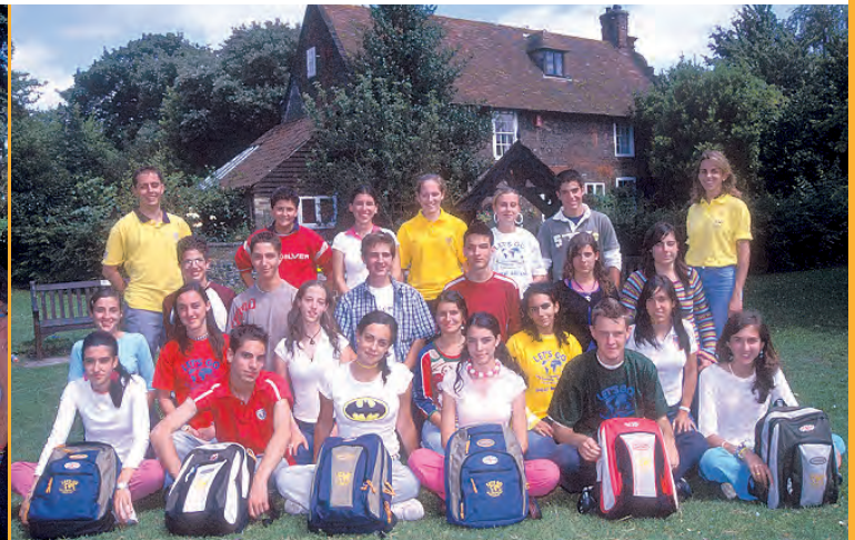
Tu participación en los viajes escolares LET S GO te proporcionará un bagaje cultural muy útil e inolvidable.