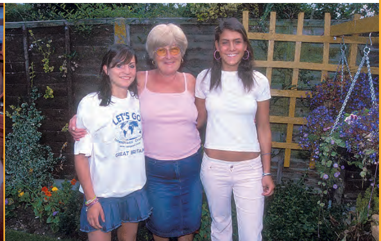
Tu familia anfitriona te ayudará para que tu estancia con ellos sea lo más agradable posible.