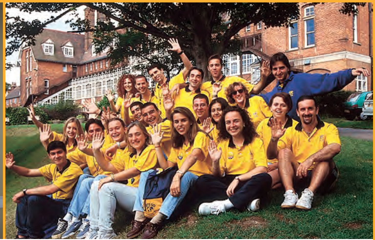
Te damos la bienvenida a los viajes escolares a Inglaterra LET'S GO.