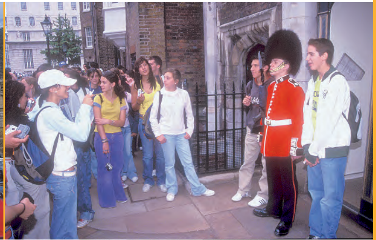
También realizarás dos excursiones a Londres para visitar la ciudad, el British Museum e ir de compras.