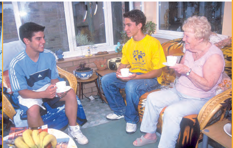
Estarás alojado en una familia británica anfitriona y conocerás personalmente la forma de vivir en Inglaterra.